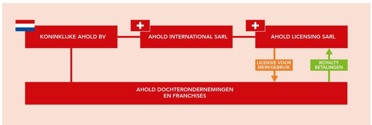
Figuur 4 Ahold's dochter in Zwitserland