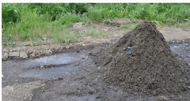
Illegale dump van mest buiten Vinnytsia-complex.