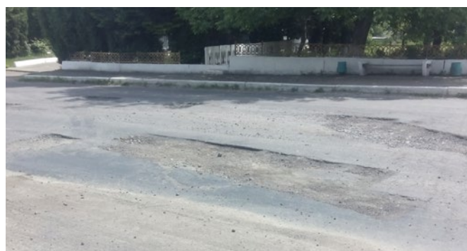
De dorpswegen zijn niet gebouwd op zwaar vrachtverkeer.