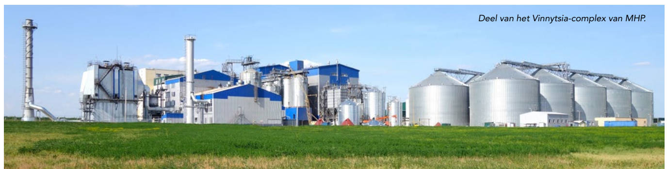
Deel van het Vinnytsia-complex van MHP.

Met bijna € 0,5 miljard aan financiering van ontwikkelingsbanken kon het bedrijf zijn activiteiten uitbreiden en verticaal integreren om zo het grootste pluimveebedrijf van Oekraïne te worden. Bovendien profiteerde MHP van het wegvallen van invoerrechten voor hun exportproducten naar Europa. De EU is voor MHP de snelst groeiende exportmarkt en naar verwachting worden de quota voor belastingvrije invoer van producten in de toekomst verruimd. De uitbreiding van het Vinnytsia-complex eind 2015 ondersteunt dan ook de exportstrategie van MHP.