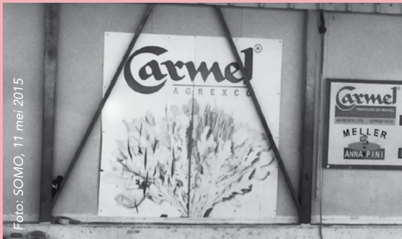
11 mei 2015

De OESO-richtlijnen stellen dat bedrijven dienen te voorkomen dat zij met hun eigen activiteiten bijdragen (contributing) aan 'ongunstige effecten', zoals mensenrechtenschendingen. Wanneer zij via de activiteiten of producten van een zakelijke relatie verbonden zijn aan mensenrechtenschendingen (being directly linked) dienen ze dit te voorkomen of verminderen. 25 Deze 'zakelijke relatie' strekt zich uit tot ketenpartners, inclusief toeleveranciers. 26 Bedrijven dragen bij aan ongunstige effecten wanneer zij via of met een andere partij mensenrechtenschendingen. Bijvoorbeeld wanneer een bedrijf kleding produceert in een fabriek in Bangladesh waar werknemers door fabriekseigenaren uitgebuit worden. Bedrijven zijn verbonden aan ongunstige effecten wanneer zij niet zelf bijdragen aan mensenrechtenschendingen, maar daar via activiteiten, diensten of producten aan gerelateerd zijn. 27 Een voorbeeld is een fabrikant van mobiele telefoons die onderdelen geleverd krijgt via een keten van toeleveranciers, waarvan de materialen uit de Democratische Republiek Congo komen, die daar gewonnen worden in mijnen van rebellen.