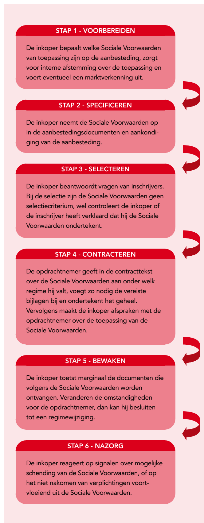
Figuur 2: Stappenplan Sociale Voorwaarden