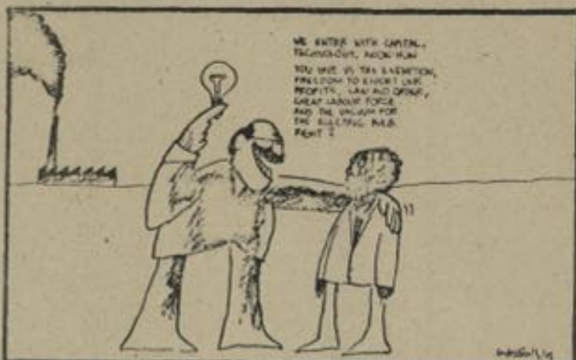
Wij komen met kapitaal, technologie en know-how. Jullie geven ons belastingvrijstelling, vrijheid om onze winsten uit te voeren, orde en regelmaat, goedkope arbeidskrachten en het vakuum voor de elektrische gloeilamp. Afgesproken! (Tekening uit een UNCTAD-krant)

En vooral ook: wat voor verstrekende uitwerking dat heeft op de inkomensverhoudingen in een land als Kenya. EAL zit gezondheid rumschoots de helft boven de lonen die